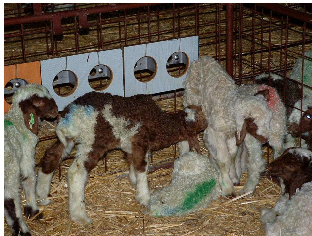
Picture 1: Artificially reared Awassi lambs suck each others