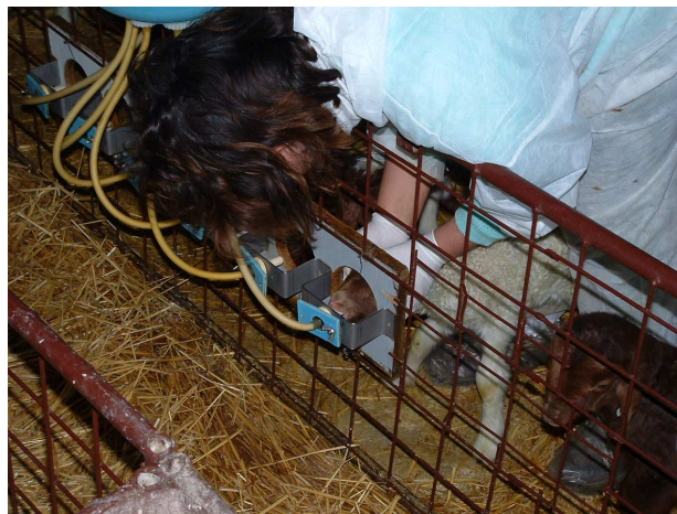
Picture 3: Feeding of lambs by the stockperson in artificial rearing system