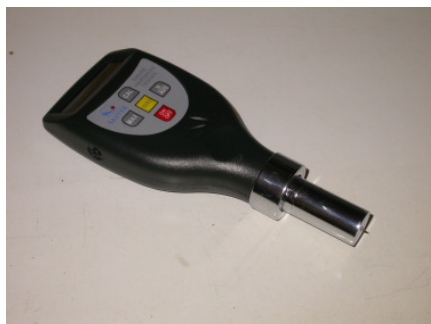
1. kép: A mérőműszer

A származásvizsgálathoz szükséges vérvétel alkalmával befogott nőivarú állatok bal szarvából vettük a mintákat, egy vonókés segítségével. A minták 7-10 cm hosszúságúak, valamint 3-5 mm vastagok voltak. A mintákat megszámozva, légmentesen csomagolva tároltuk, majd rákövetkező napon a Budapesti Műszaki Egyetem Polimertechnika Tanszékén mértük meg azok keménységét.