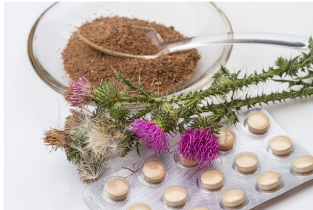
Figure 2: Milk thistle and some products