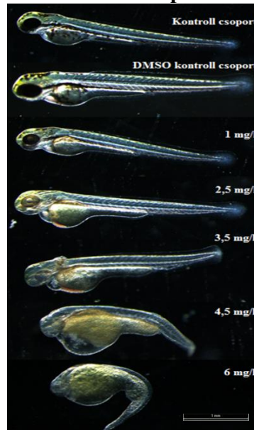
Figure 1: Images of treated larvae: Images of larvae after treated by 3A9EC during FET test in 72 nd hour